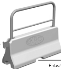
Entwässerung mittels Queröffnungen