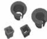
Elastomerauflager für hohe Stabilität und Sicherheit