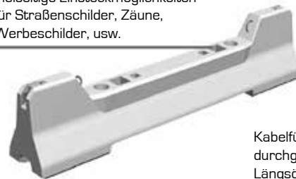
Kabelführung in durchgängiger Längsöffnung